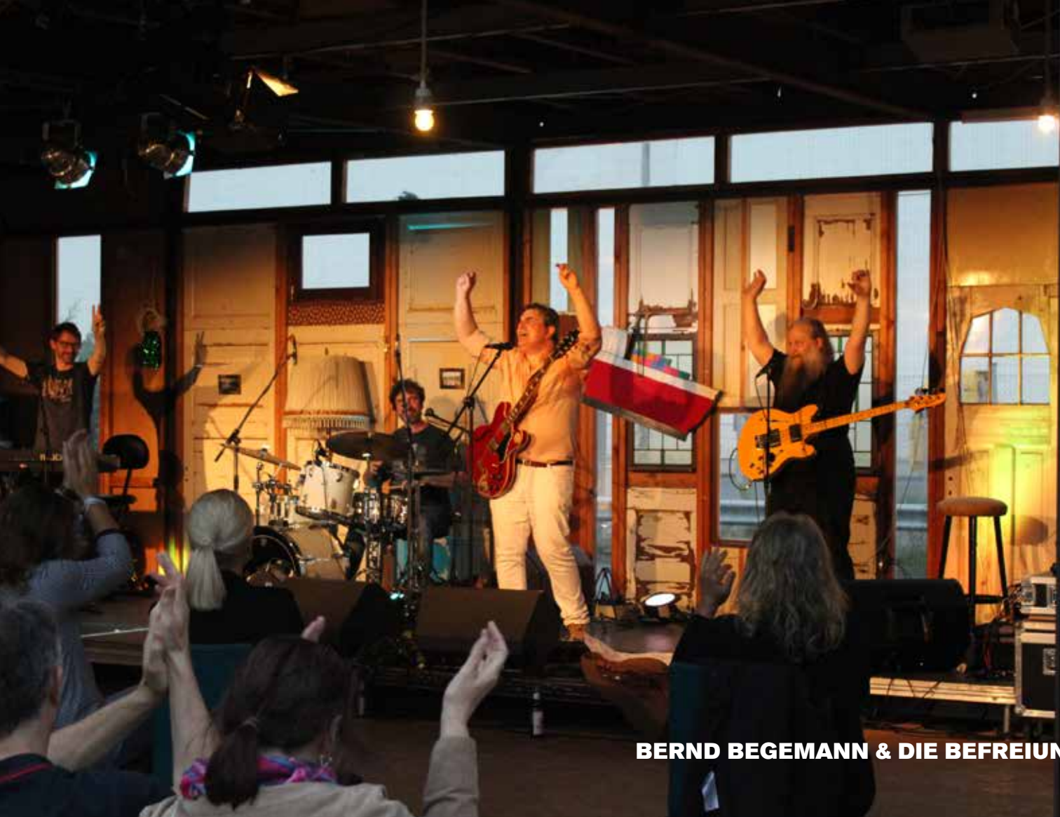
BERND BEGEMANN & DIE BEFREIUNG